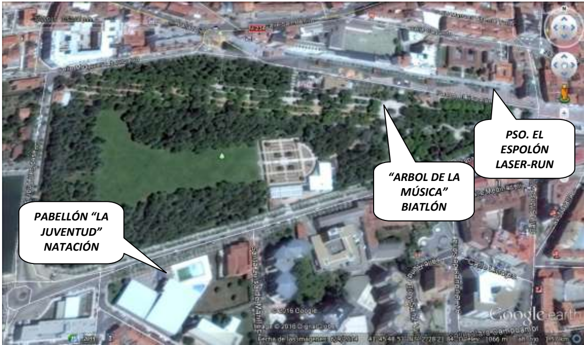
SORIA ZONA COMPETICIÓN